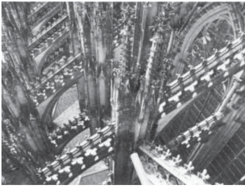
Strebwerke des Kölner Domes, aufgenommen vom Umgang südliches Querhaus.

Beschreibung der Deutschen UNESCO - Kommission.