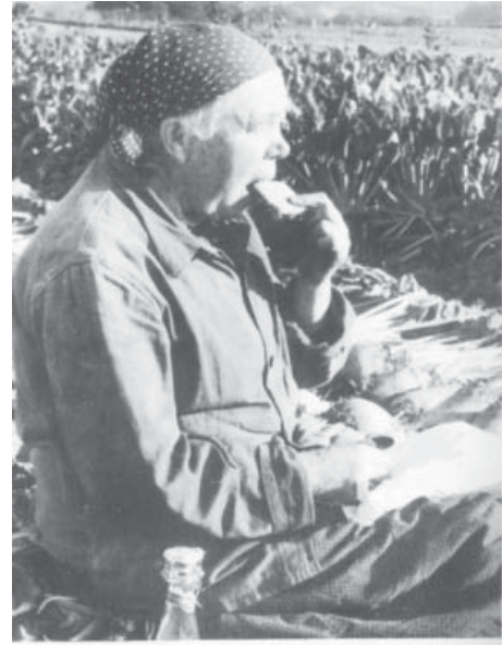
Kaffeepause auf dem Feld, Sommer 1943

Quellen: Frauen in Oberberg, Museum des Oberbergischen Kreises Verlag Gronenberg Otto Kaufmann Volkserzählungen aus dem Homburger Land