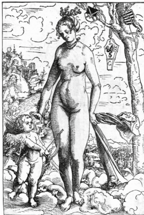
Lucas Cranach der Ältere, „Venus und Cupido“, etwa 1508, Britisches Museum