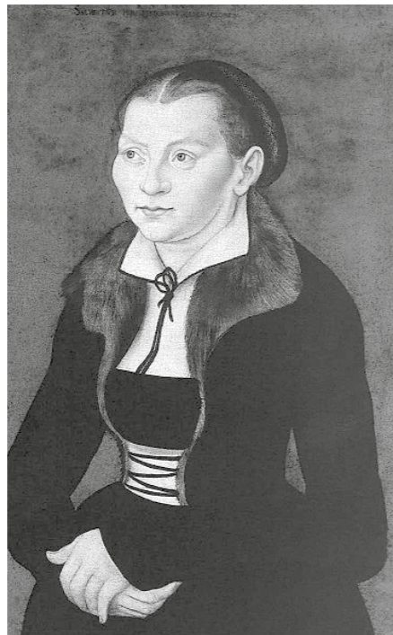
Katharina von Bora (Lucas Cranach der Ältere, 1529, Deutsches Historisches Museum Berlin)