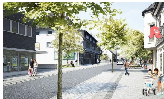
Mögliche Umgestaltung der Bahnhofstraße Abbildung: Lex Kerfers Landschaftsarchitekten

Der symbolische Spatenstich zur Umgestaltung des Bereichs Bahnhofstraße fand am 22. Juli 2021 mit Vertretenden des Stadtrates und den am Bau beteiligten Firmen auf dem Rathausvorplatz statt. Mehr Informationen finden Sie hier .