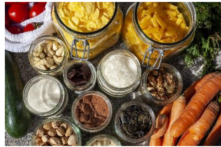
Verpackungsfrei Einkaufen

Wir möchten unseren Kunden ein umweltfreundliches und entspanntes Einkaufserlebnis bieten. Von Nudeln, Getreide, Ölen, Kosmetik, Waschmittel bis Haushaltsaccessoires ist alles dabei.