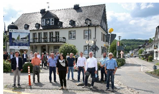
Symbolischer Spatenstich