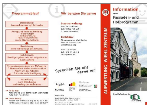
Flyer Fassaden- und Hofprogramm Abbildung: Planungsgruppe MWM Aachen

Haben auch Sie Interesse an einer Teilnahme am Fassaden- und Hofprogramm? Dann nehmen Sie gerne Kontakt mit der Ansprechpartnerin Frau Beate Grimm auf (Tel.: 02262 99 233, E-Mail: b.grimm@wiehl.de ) oder werfen Sie einen Blick in den kompakten Flyer .