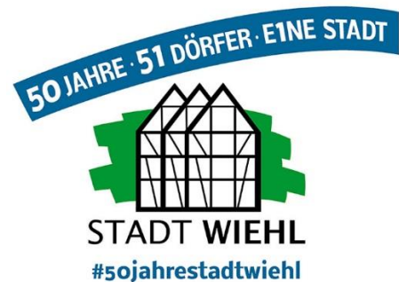
Logo 50 Jahre Stadt Wiehl Abbildung: Stadt Wiehl

Seit 50 Jahren darf sich Wiehl „Stadt“ nennen. In normalen Zeiten ein besonderes Ereignis mit einer großen Jubiläumsfeier. Da dies in der aktuellen Situation nicht möglich ist, geht die Stadt Wiehl andere, aber spannende Wege. Unter dem Motto „50 Jahre. 51 Dörfer. Eine Stadt“ dürfen sich alle Bürgerinnen und Bürger auf viele feierliche Aktionen im Verlauf des Jahres freuen - darunter auch einige im Wiehler Zentrum.