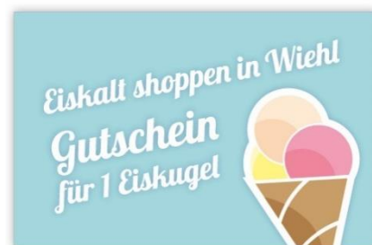
Gutschein Eiskalt shoppen in Wiehl Abbildung: Werbeproduktur Simons

Der Wiehler Ring und das Citymanagement laden alle Kundinnen und Kunden ein, in den Wiehler Geschäften vorbeizuschauen, nach Herzenslust zu shoppen und sich mit einem leckeren Eis zu verwöhnen.