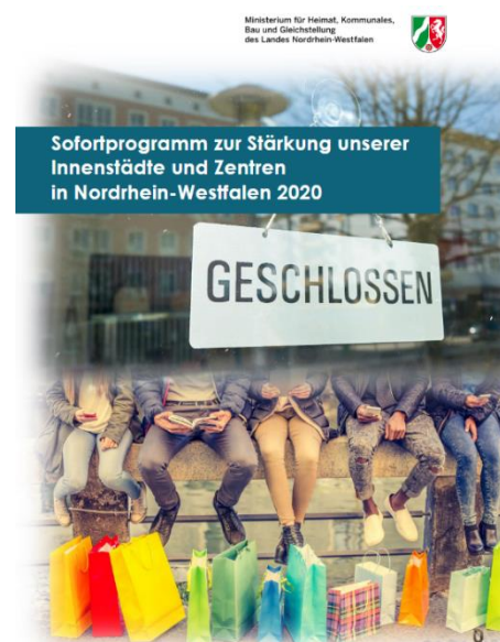
Abbildung: Ministerium für Heimat, Kommunales, Bau und Gleichstellung des Landes Nordrhein-Westfalen

Vereinbaren Sie am besten einen Termin unter 02262 – 99 207 oder unter citymanagement@wiehl.de .