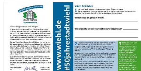
Postkarte Stadtgeburtstag

Abgenäht | Apotheke Oberberg | Auge + Ohr und Atelier Althöfer | Biomarkt Landgefühl | Buchhandlung Hansen und Kröger | Day Spa Friseur Klos | Edel und Stahl | Flotte Socke | Herrenausstatter Mode Tenne | Lang Raum Idee | Maiworm | Metzgerei Müller | Plaza de Sol Pan Pan | Schön Ding und Weile | Schönheitsfleck | Schuhmann | Schuhmoden Seitz | Sport Hennecken | Sümpfchen | Wiehl Apotheke | Wiehltaler Hof