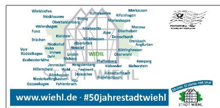
Postkarte Stadtgeburtstag Abbildung: Stadt Wiehl

Die Stadt Wiehl hat ca. 12.500 Postkarten an die Wiehler Haushalte versendet. Neben den zwei Fragen „Warum lebe ich gerne in Wiehl?“ und „Was wünsche ich der Stadt Wiehl zum Geburtstag?“ werden die Bürgerinnen und Bürger angeregt, Bilder aus 50 Jahren Stadtgeschichte einzusenden.