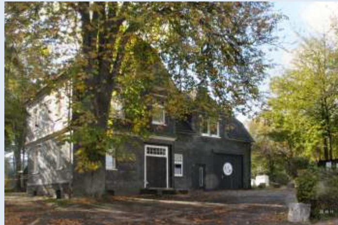
Das Vereinshaus "Alte Schule" mit Backes am Wanderparkplatz

Wir freuen uns über jedes neue Vereinsmitglied, das die Dorfgemeinschaft stützt. Mitglied im HVV kann jeder Bürger ab 16 Jahren werden. Der Mitgliedsbeitrag beträgt 10€ pro Jahr. Einfach den beiliegenden Mitgliederantrag ausfüllen bzw. über die Internetseite herunterladen und in den kleinen gelben Vereinsbriefkasten neben dem Eingang zum Nahkauf Küper einwerfen.